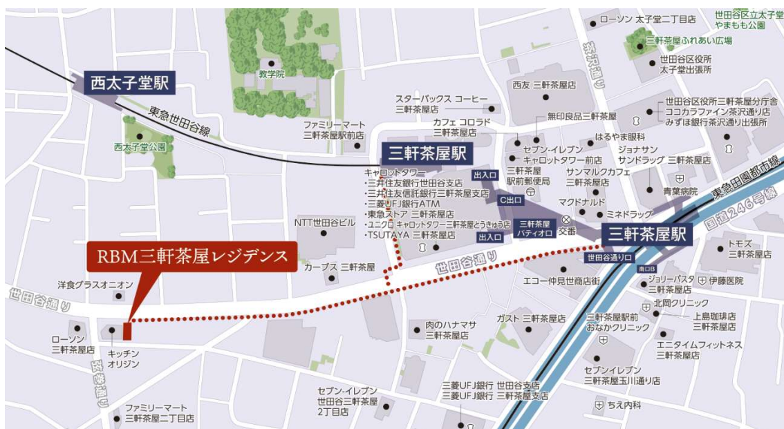
RBM 三軒茶屋レジデンス現地案内図