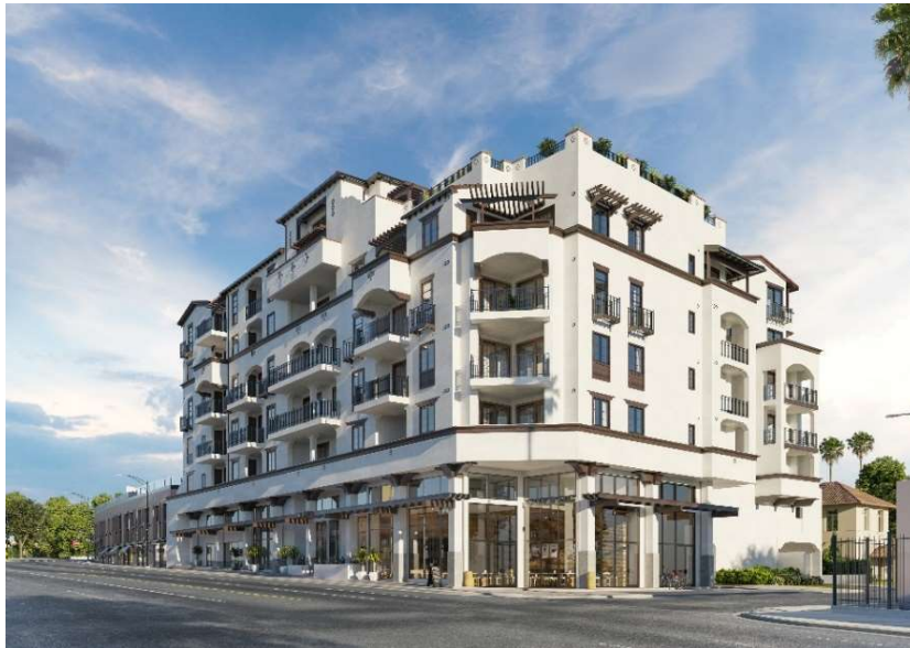
RBM LaBrea & 12th Apartments 外観写真