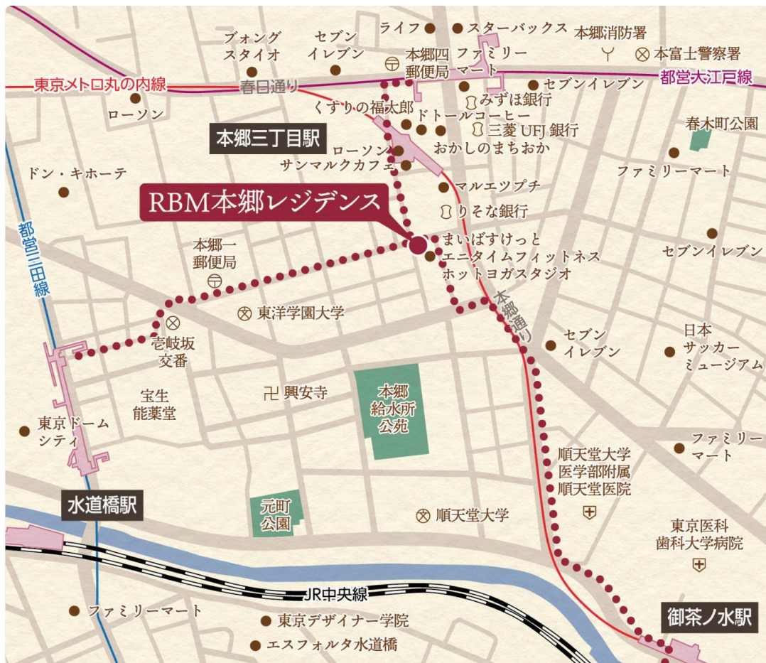
R B M本郷レジデンス 現地案内図