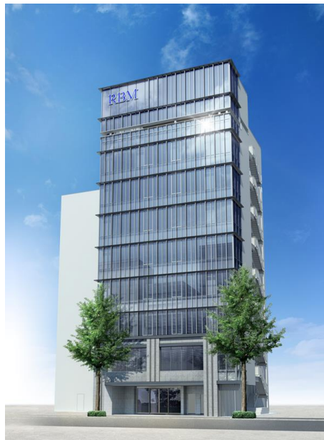
RBM神田ビル 外観パース

レジデンス・ビルディングマネジメント株式会社が開発を進めておりました、新築オフィスプロジェクト「RBM神田ビル」が、2022年3月31日(木)に竣工しましたので、お知らせします。