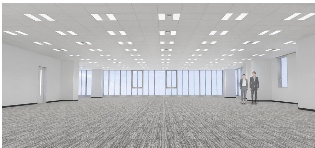
RBM 神田ビル 基準階パース

各階貸室の契約面積は、約133坪。無柱空間の貸室は、レイアウトの変更が容易なグリッド式天井システムを採用することで、フレキシブルな活用を可能にしました。また天井高は2.8mを確保し、窓面高さ2,600mmのガラスカーテンウォールを採用することで、採光に優れた開放的な執務空間を実現しています。